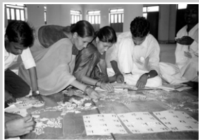
표지사진 : 인도 동게스와리 여성들이 문자해독교실에서 교육을 받고 있는 모습.