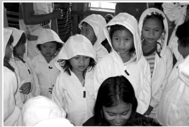
알라원 학교준공식때 JTS가 후원한 옷을 입고 있는 마을 아이들

알라원이 있는 이곳 민다나오 섬은 분쟁이 많은 지역으로 알려져 있고, 그래서 JTS는 분쟁이 많은 이 지역에 평화를 정착시키기 위한 활동을 펼치고 있다. 분쟁은 소외시킨자와 소외받은자간의 다툼으로 시작된다. JTS는 이곳에 학교를 세우고 마을 개발사업을 진행하여 소외받은 사람들의 마음을 풀어주고 지리적, 종교적 이유로 단절되고, 때론 대치상태에 까지 이른 곳에 교류와 협력을 통해 평화를 이루어나가도록 노력하고 있다. 그리고 그 평화의 씨앗이 이곳 알라원에서 싹싹하게 자라나고 있다. [JTS]