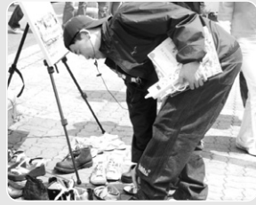
"내가 찾던 신발이네~"