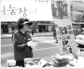
살림경력 30년의 노하우가 여기에~