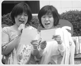
수자타 아이들이 부르는 교가를 다함께