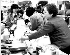
“접시는 일단 접수하고, 후라이팬은 얼마예요?”