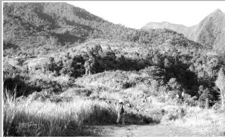
알라원 올라가는 길의 푸른산의 모습

그런데 JTS가 학교 건축사업을 하면서 JTS의 자원봉사자들이 수시로 알라원을 다니게 되었다. 그때마다 바랑가이 실리폰 사람들은 자원봉사자들에게 괜찮냐고, 무섭지 않냐고 물어보곤 했다. 그러던 중 우리 자원봉사자들이 당신들이 직접 한번 가보면 어떻겠냐고 제안하여 그중 JTS 사업에 관심이 있어 하는 몇몇 사람들이 직접 알라원을 방문하고, 그들과 같이 생활하고, 며칠씩 잠도 자고 오고 하면서 바랑가이 사람들에게는 알라원이라는 곳이 더 이상 두려움의 장소가 아니게 되었다.