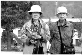
표지사진 : 두북 어르신들의 봄 나들이