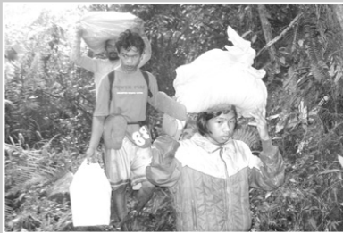
지원물품을 머리에 이고 가는 마을 사람들, 알라원 학교건축자재나 지원물품들은 모두 마을사람들이 협력하여 운반하였다.

또 알라원 사람들도 바랑가이로 내려오면 같이 어울리게 되고 점점 가까워지게 되었다. 2006년 8월 알라원 학교 준공식이 있던날 바랑가이 캡틴(면장), 바랑가이 교육 관계자, 알라원에 관심 있어 하는 마을사람, 학교 건축에 같이 참가했던 사람들 등과 알라원 마을 주민, 그리고 JTS관계자가 한자리에 모여 준공식을 진행하였다. 이후로 알라원 주민들과 바랑가이 주민들은 서로 친구가 되었다고 한다. 학교가 지어지기 전에는 바랑가이 주민 대부분이 두려워했던 알라원 사람들이, 이제는 대부분이 친구가 되어 만나고 있다. JTS가 학교 사업을 지원하면서 알라원 마을 사람들도 하나로 뭉쳐 스스로 자원봉사도 하고, 힘을 합쳐 일을 함께 도모하는 소중한 경험을 가졌다.