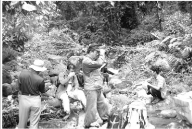
땀을 식히며 알라윈 가는 길에 잠깐 휴식하는 모습

Alawon(알라윈). 처음 이 지역에 대해 들었을 때는 ‘저 길을 어떻게 가냐’ 하던 시절이 있었다. 알라윈은 정글이다. “타잔”이란 영화에서만 보던 정글. 다행히 사람 한명 겨우 지나갈 정도의 길이 있긴 하다. 정글 입구에서 부터 5시간 반은 걸어야 사람들이 사는 곳이 나온다. 약 18킬로미터의 거리. 가는 중간에는 정글 거머리가 많아서 조심해야하는 곳. 이렇게 산골 중의 산골 마을에 JTS가 학교 지원 사업을 시작한 것은 2005년 가을이다.