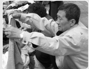
“이거 나한테 어울릴러나~”