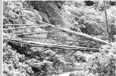
계곡을 건너는 아슬아슬한 다리

필리핀 JTS 이원주 대표님은 말로만 듣던 이곳을 직접 방문하고는 정말 힘들었던 당시를 회상하셨는데, 시쳇말로 “거의 죽다 살아났다” 고 하셨습니다. 지금은 길이 잘되어 있지만 그 당시만 해도 풀로 덮혀 있어서 앞이 보이지도 않고, 우기철 이라 큰 비도 만났다고 한다. 들어갈 때 정글에서 5시간 반을 헤매고, 나올 때는 비가 오기 시작하여 앞도 보이지 않더라고 했다. 우기철의 알라윈은 오후 1시에서 2시경에는 비가 시작된다. 비가 올 때는 평소 사람들이 사용하는 길이 물 흐르는 수로로 바뀌어 버린다. 그렇게 어렵게 방문하기 시작한 이 지