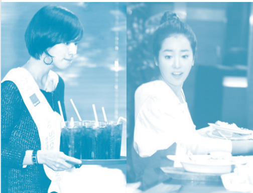
열심히 일일 아르바이트를 하고 있는 두 분