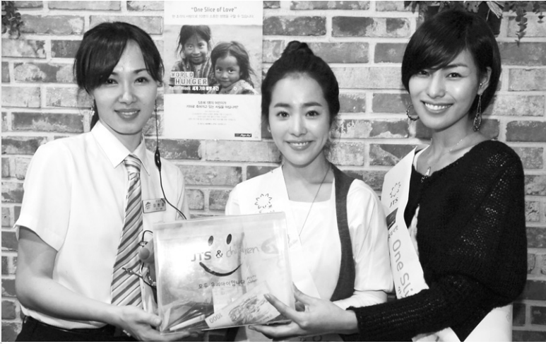
피자헛 학동점 직원에게 모금함 전달