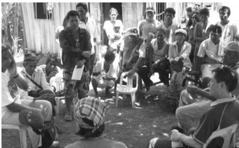
사진 왼쪽 흰 티셔츠를 입고 의자에 앉아 이야기를 듣는 분이 다몰록시 시장님

이번 답사 지역은 부키드논 주 다몰록시 주변의 산간마을인 파나푸난 (Panaponan), 발루드 (Balud), 키드마 (Kidama), 포록 6 (Porok 6) 등 총 4개 지역과 현재 학교 공사 중인 사라와곤 (Sarawagon)였습니다. 이중 Balud라는 곳은 행정 구역상 다른 주 (북코타바토주)에 속해 있지만, 그 지역정부에서의 기본 시설 지원