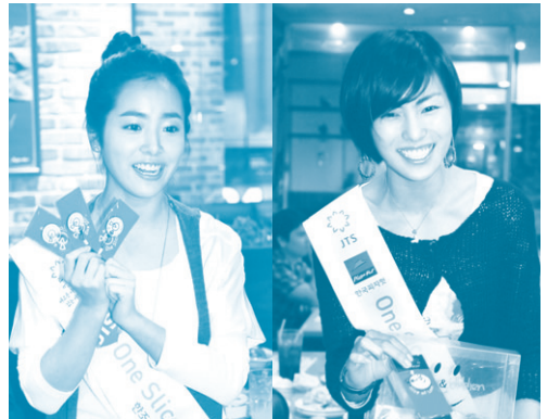
"2,000원이면 북한 어린이 20명을 살릴 수 있어요~"