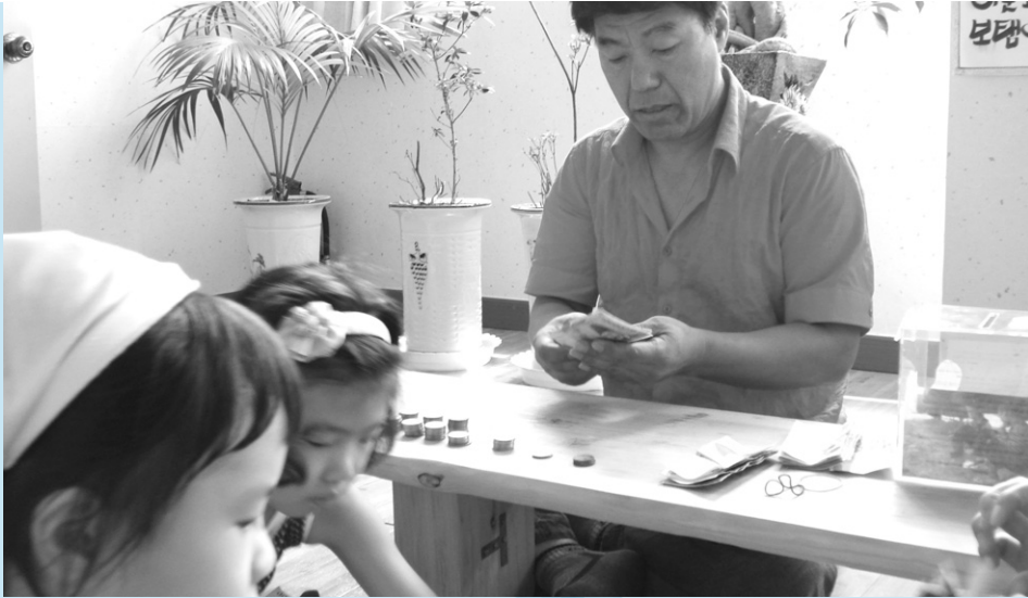
노래 교실 회원들이 십시일반 모아주신 성금을 헤아리는 노래 강사님. 벌써 62만원이 모아졌습니다. 이 돈은 620명의 북한 어린이가 보름동안 목숨을 연명할 수 있는 양식이 됩니다.