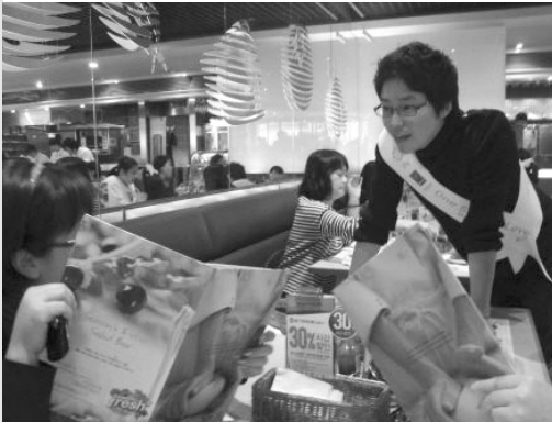
피자헛 대학로점에서 손님들에게 서빙하고 있는 탤런트 김여진씨와 엄기준씨