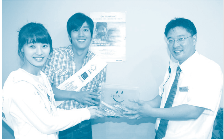
피자헛 이수점 직원에게 모금함 전달