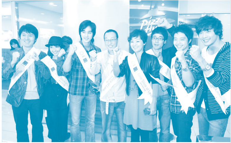
피자헛 흥대점에서 봉사를 마치고 '그들이 사는 세상' 팀