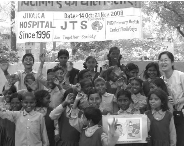
프로그램 후 다같이 기념사진