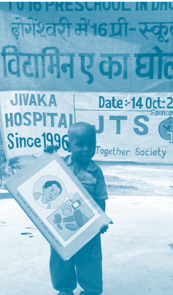
교육책자를 들고 있는 유치원생